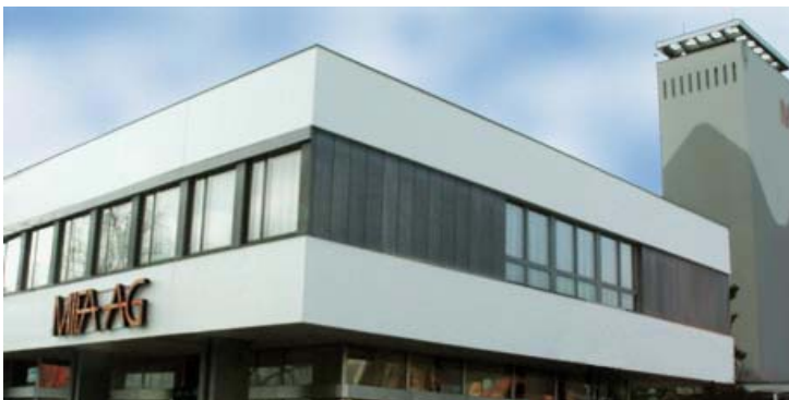
MIFA AG, Frenkendorf